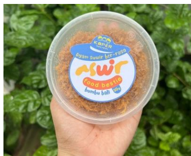
Gambar 7. Perubahan Stiker Kemasan

Berdasarkan perbandingan dengan desain sebelumnya, menunjukkan beberapa filosofi dan arah pengembangan brand: