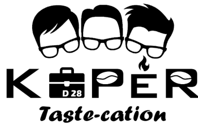
Gambar 1. Desain Logo Produsen

Koper Tastecation ini dibangun oleh wirausahawan muda bernama Doddy Hendarto Laksono dan kedua saudaranya. Gambar 1 diatas merupakan Logo Produsen dengan nama Koper Tastecation yang mana filosofi pembuatan logo produsen memunculkan 3 orang laki-laki yaitu Kak Doddy dan saudara-saudaranya. Produknya berupa abon ayam yang berbahan dasar ayam suwir premium yang disingkat "ASWIR" dengan aneka rasa pilihan antara lain rasa soto, kare pedas, lada hitam dan bumbu bali