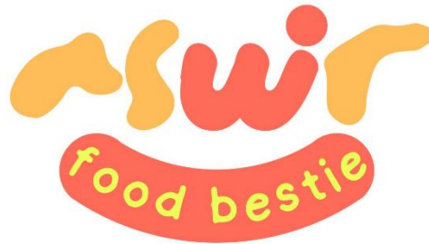
Gambar 3. Desain Logo Produk Penulisan ASWIR

Koper tastecation ini merancang Logo dengan mengimplementasikan penggunaan canva yang bertujuan meningkatkan daya tarik konsumen dengan melihat Logo dan kemasan. Logo itu sendiri berasal dari Bahasa Yunani yaitu Logos yang berarti pikiran atau adalah penyajian atau tampilan nama, bentuk seragam, tulisan, atau ciri khas perusahaan secara visual (Anggoro, 2001). Menurut Kusrianto (2009: 232) bahwa logo atau tanda gambar (picture mark) merupakan identitas yang dipergunakan untuk menggambarkan citra dan karakter suatu perusahaan maupun organisasi. Logo adalah tanda visual yang berfungsi sebagai pemberi tahu keaslian sebuah produk dan melalui gambar dapat mengimpresikan nilai dan fungsi perusahaan kepada konsumen. (Rockport, 2007). Selain memiliki tujuan, logo juga memiliki beberapa fungsi. Menurut John Murphy dan Michael Rowe (1998) fungsi-fungsi dari logo yaitu: