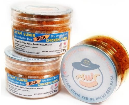
Gambar 6. Kemasan Aswir Pertama

Kemasan menggunakan jar plastik transparan dengan tutup ulir (screw lid). Analisisnya: