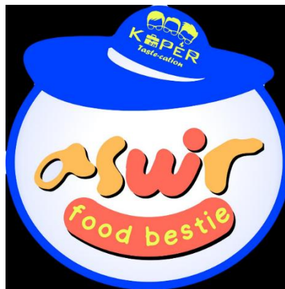
Gambar 5. Desain Ditambahkan Logo Produsen Menggunakan Canva

Penambahan logo produsen (Koper Tastecation) diatas topi. Tulisan "Koper Tastecation" (kombinasi kata Traveler/Koper dan Tastecation = Taste + Vacation) menambah makna: