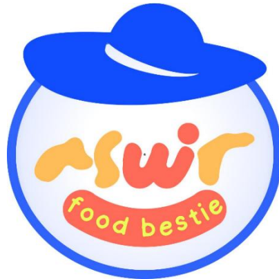
Gambar 4. Desain Penambahan lingkaran dan Topi dengan canva

Huruf melengkung menandakan ramah, fun, approachable. Bentuk yang tidak kaku memberi citra kasual dan kekinian, cocok untuk target pasar muda atau keluarga (Scolari, 2012).