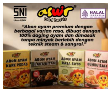
Gambar 8. Kemasan Praktis dan Ekonomis

Selain menyediakan kemasan plastic jar bening, Koper Tastecation juga menawarkan kemasan lain. Gambar 8 merupakan tampilan kemasan praktis dan ekonomis berbahan sachet aluminimun dan dikemas dengan kardus diluarnya, didesain menggunakan Canva yang bertujuan memudahkan dibawa untuk traveling dan lebih ramah lingkungan, serta lebih praktis dalam kemasan ekonomis.