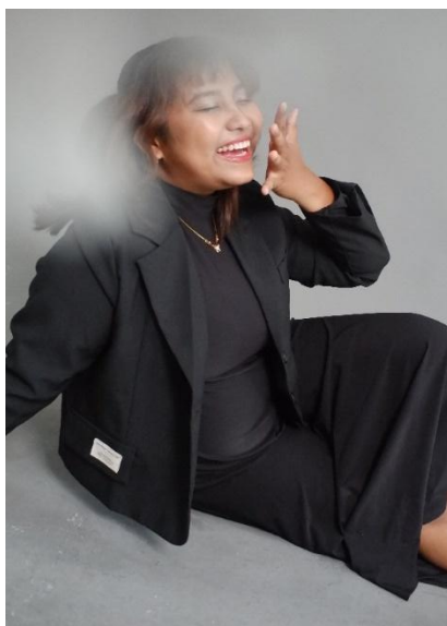
Gambar 7. Raya melepaskan semua beban