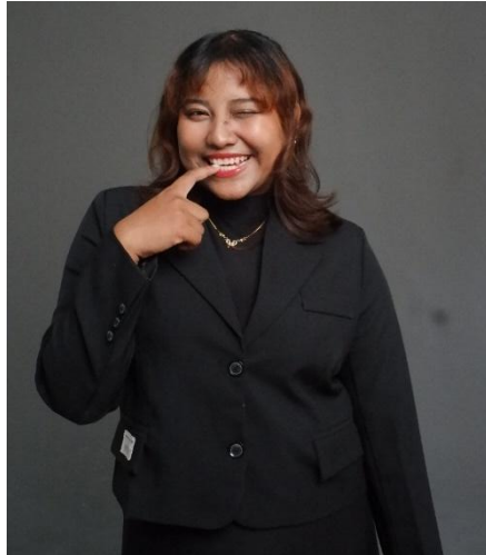
Gambar 8. Raya melihat keunikan dalam dirinya