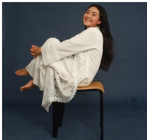
Gambar 3. Asihta sudah berdamai dengan dirinya