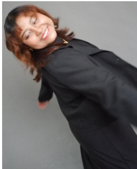
Gambar 9. Raya tampil mempesona dengan gayanya sendiri