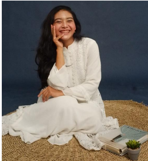
Gambar 2. Asihta melepaskan semua beban