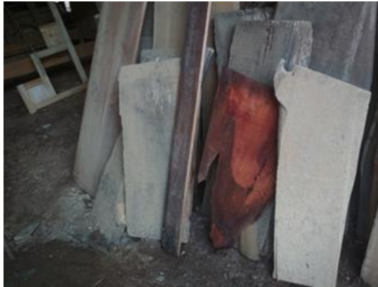
Gambar 2. Pemilihan Kayu

Proses pemilihan kayu yang masih bisa digunakan dari beberapa potongan kayu yang mungkin sudah tidak dipakai lagi.