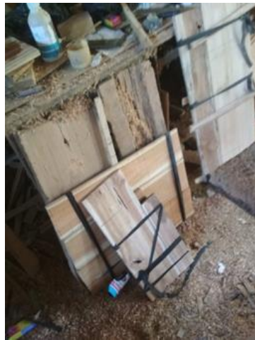
Gambar 4. Penyambungan Potongan.

Kemudian proses penyambungan dari proses sebelumnya, yaitu potongan-potongan kayu satu dengan yang lainnya.