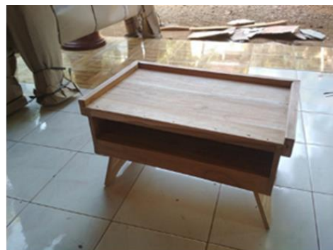
Gambar 5. Perangkaian Potongan Kayu.