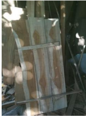
Gambar 3. Pengukuran dan Pemotongan Kayu.