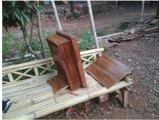
Gambar 6. Pewarnaan Produk.