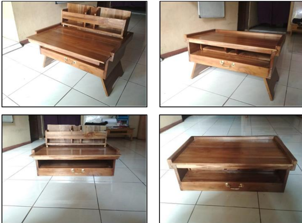
Gambar 7. Hasil dari Proses Finishing