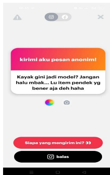
Gambar 1. Bukti Cyberbullying di NGL

Salah satu narasumber kita merupakan seorang mahasiswi yang cukup dikenali di kampus dan aktif dalam berbagai kegiatan sosial. Mahasiswi berinisial ‘J’ ini juga merupakan seorang model dari salah satu agency rumah bakat di Kota Medan. ‘J’ mengaku bahwa dirinya sering mendapatkan pesan-pesan yang berupa hinaan terhadap fisiknya, dan kejadian ini sering didapatkan disaat ‘J’ bermain media sosial dan menyebarkan link NGL nya, hal ini termasuk dalam cyberbullying di media sosial. Berikut ini salah satu contoh bukti cyberbullying yang dialami ‘J’ melalui akun media sosial NGL miliknya: