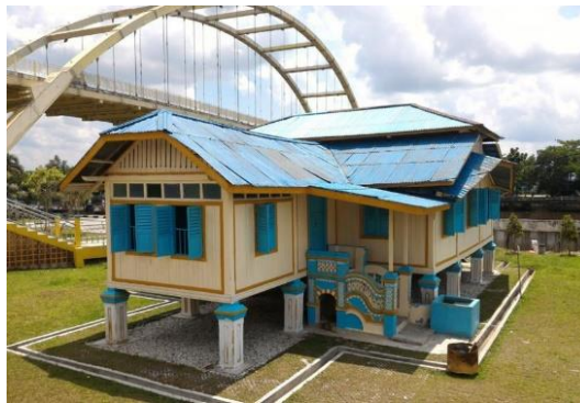
Gambar 5. Eksterior Rumah Tuan Kadi – Atap