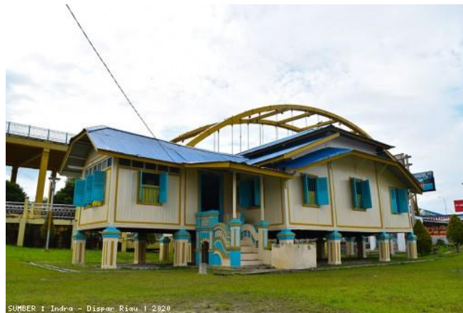
Gambar 8. Rumah Singgah Tuan Kadi