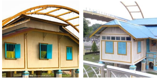
Gambar 4. Eksterior Rumah Tuan Kadi – Dinding