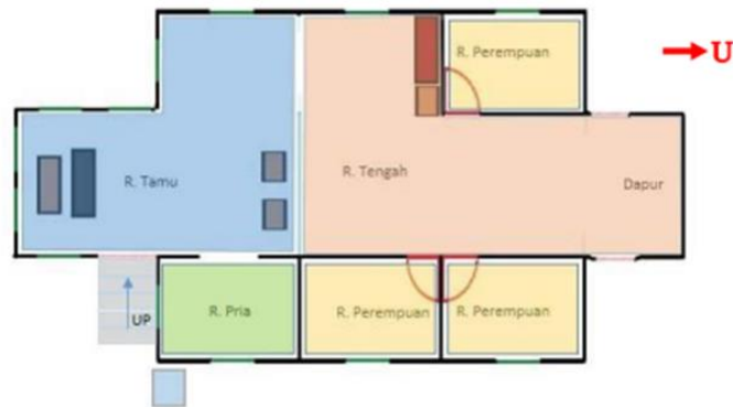
Gambar 7. Denah Rumah Singgah Tuan Kadi