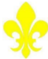
Gambar 11. Motif Ukiran Fleur De Lies (Google Image)