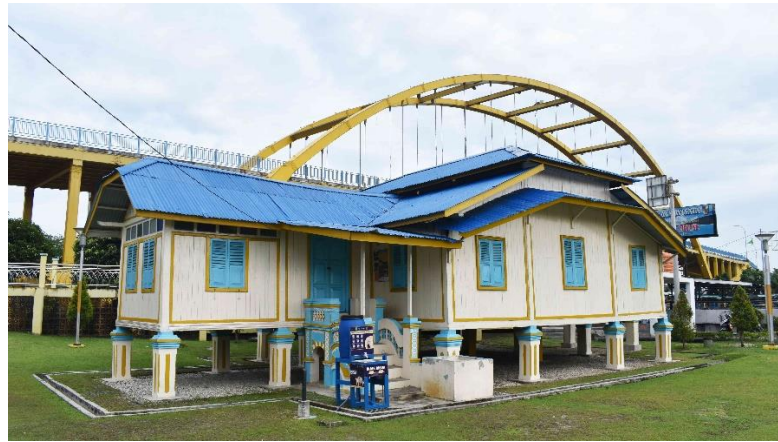
Gambar 2. Kawasan Taman dan Rumah Singgah Tuan Kadi

area publik dan area privat. Area publik merupakan area yang dapat diakses oleh para tamu yang berkunjung dan penghuni rumah pada sisi bangunan selatan yakni ruang tamu atau ruang perjamuan dan ruang atau bilik laki-laki yang bertujuan agar lebih aman. Area privat merupakan ruang-ruang yang lebih dikhususkan untuk penghuni rumah dan yang berkepentingan atau wilayah perempuan yakni ruang tengah, kamar tidur, dan dapur.