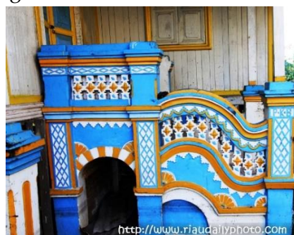
Gambar 6. Ukiran pada tangga