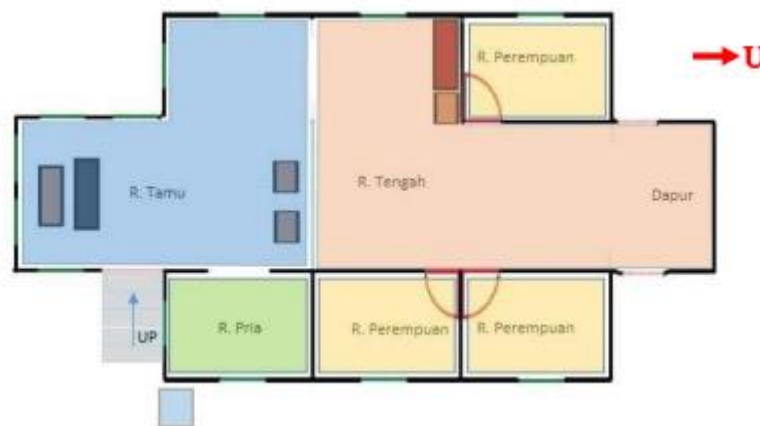
Gambar 3. Pembagian Area Rumah Tuan Kadi - Awal (Dokumen Pribadi)

Perubahan fungsi rumah mulai terjadi pada tahun 1928, rumah ini diambil alih oleh pihak Belanda sebagai salah satu kantor. Bagian yang mengalami perubahan yakni tangga yang dibangun dengan ukiran keterangan tulisan angka yang merupakan tanggal pembuatan tangga pada sisi kanan yakni "23:7" dan "PKB" yang merupakan tanggal dan bulannya serta penanda wilayah bangunan berada di Kota Pekanbaru. Lalu pada sisi kiri tangga terdapat ukiran tulisan "1928" yakni tahun tangga dibangun. Terdapat enam anak tangga yang jika dihubungkan dengan nilai keislaman yakni perlambangan jumlah rukun iman.