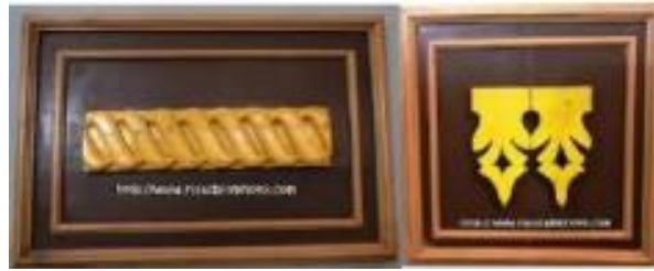
Gambar 10. Motif Ukiran Melayu Hewan