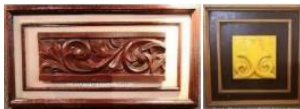
Gambar 9. Motif Ukiran Melayu Tumbuh-tumbuhan (Google Image)