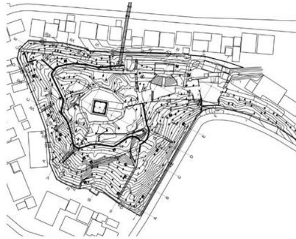
Gambar 3. Kontur Eksisiting Kawasan Benteng Fort De Kock

Berdasarkan data lapangan yang diperoleh dapat di analisa bahwasannya pada kawasan Fort de kock terdapat pembagian zona kawasan sebagai berikut: