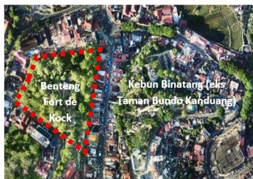
Gambar 1. Foto Udara Kawasan Benteng Fort De Kock

Saat ini, secara fisik bangunan Benteng Fort de Kock sudah tidak ada. Bangunan yang masih tersisa berupa bangunan bak air berbentuk segi empat yang dibangun tahun 1932. Areal pada bekas benteng dibatasi oleh parit melingkar sedalam 1 meter dan lebar sekitar 3 meter. Selain itu masih terdapat beberapa peninggalan yang berhubungan dengan keberadaan benteng Fort de Kock , salah satunya delapan buah meriam besi yang ditempatkan di sekeliling area bekas benteng dengan panjang 116-280 meter. Di salah satu meriam tersebut terdapat inskripsi berupa angka tahun 1813. Pemerintah daerah setempat pernah melakukan renovasi pada tahun 2002. Kawasan dengan luas 3,5 Ha.