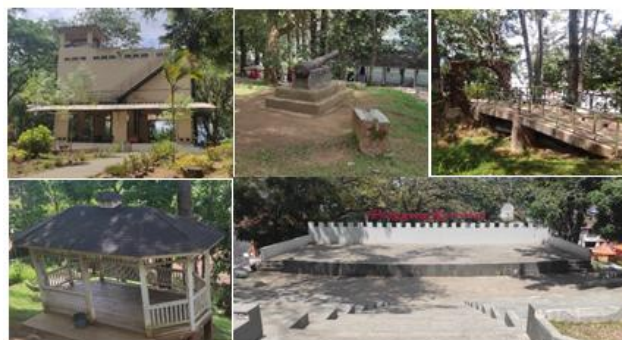
Gambar 2. Foto Eksisiting Kawasan Benteng Fort De Kock

Berikut gambaran kondisi fisik kawasan yang dapat dilihat pada dokumentasi hasil survey di bawah ini;