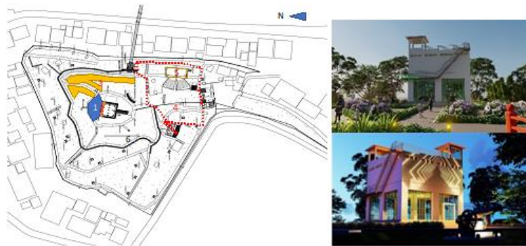
Gambar 4. Pembagian Zona Atraksi Kawasan Benteng Fort De Kock