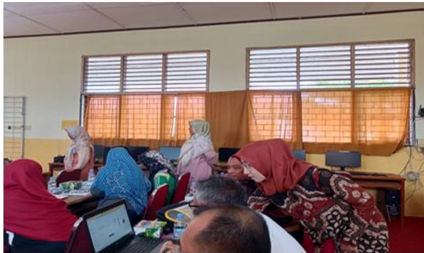
Gambar 3. Pendampingan Pelatihan Pengembangan Digital Learning SMP N 4 Kubung