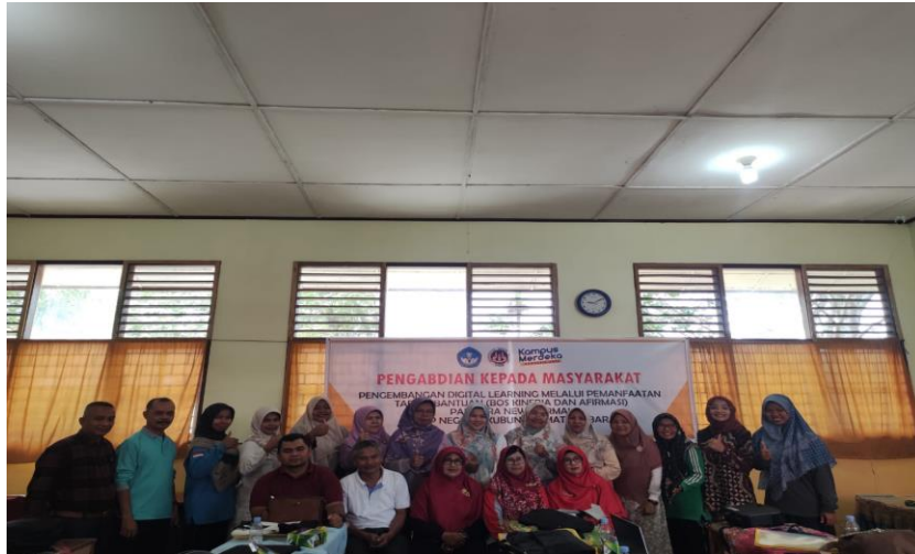
Gambar 2. Foto Bersama Tim PKM dengan Peserta Pelatihan Pengabdian Kepada Masyarakat