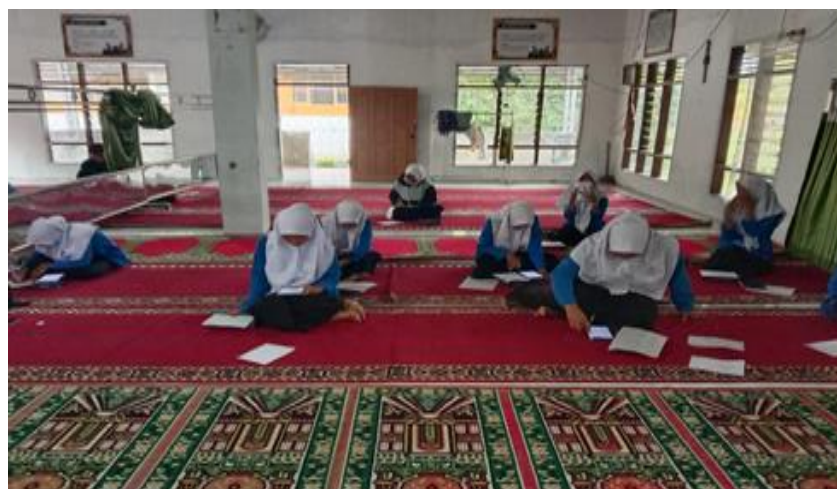
Gambar 4. Pemanfaatan Tablet untuk Ujian Tengah Semester