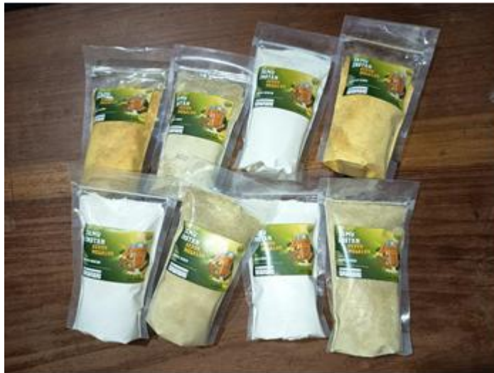
Gambar 7. Produk Jamu Instan Tiga Varian (Beras kencur, kunyit asem, dan kunci sirih)