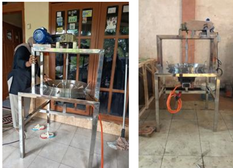
Gambar 2. Mesin Jamu Instan