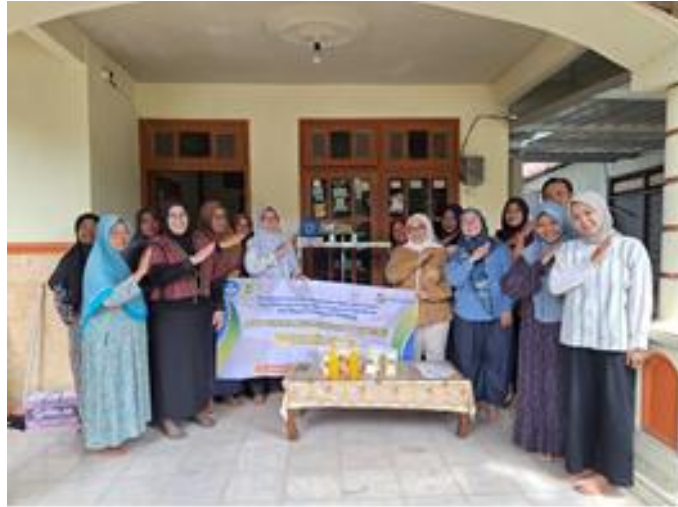
Gambar 6. Serah Terima Mesin Jamu Instan Tiga Varian