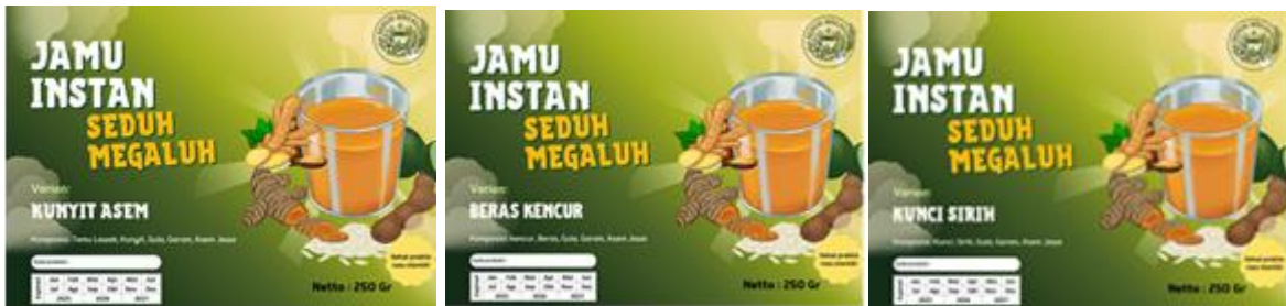
Gambar 4. Sticker Jamu Kemasan dengan Tiga Varian

Outcome, dari adanya pelatihan yang dilakukan bagi Kelompok Penjual Jamu adalah memiliki keterampilan sebagai modal dasar untuk berwirausaha, dimana produk jamu instan dapat dipasarkan sendiri dengan jangkauan yang lebih luas. Selain itu outcome lain adalah diperolehnya peningkatan kapasitas produksi sekaligus dapat menyiapkan tenaga kerja muda yang lebih terampil dengan cara merekrut peserta pelatihan yang belum mampu berwirausaha.