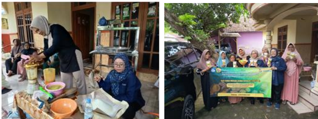
Gambar 5. Uji Coba Mesin Jamu Instan Tiga Varian

Keunggulan dari alat pembuatn jamu instan ini adalah 1) waktu penggerak yang relative singkat yaitu hanya 30-40 menit dengan kapasitas 10-15 liter. 2) tidak perlu lagi proses pengadukan yang cukup lama sampai memakan waktu 2 jam. 3) kapsitas isi yang besar. 4) tidak menggunakan wajan sehingga tidak tumpah. 5)hanya membutuhkan bahan bakar lebih sedikit. Sedangkan kelemahan dari mesin pembuat jamu instan ini yaitu tidak bisa mengolah dengan bahan baku yang sedikit, dengan minimal 1 kali adonan adalah 10 liter.