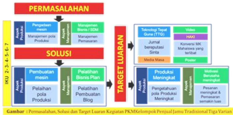
Gambar 1: Permasalahan, Solusi, Target dan Luaran Kelompok Penjual Jamu

kayu serta tanaman hemaprodit/ rimpang seperti jahe, kunyit dan sebagainya. Desa Megaluh memiliki tanah yang subur dengan hasil tanaman ubi jalar dan tanaman rimpang (Hidayatullah & SBW, 2011)(Koen Asharo, 2022). Desa Megaluh juga merupakan basis produksi dan luas lahan tanaman tembakau pada tahun 2018-2022 di kabupaten Jombang. Desa ini mempunyai rata-rata nilai produksi tanaman tembakau sebesar 9.809 ton dengan nilai LQ 11,46 dan rata-rata luas lahan 829,80 Ha dengan nilai LQ 6,60 (Junedi & Saptono, 2022) (Hidayatullah, Rachmawati, Khourouh, & Windhyastiti, 2017). Khusus tanaman rimpang kelompok wanita tani yang ada di desa memaksimalkan dengan membuat olahan rimpang seperti membuat aneka jamu tradisional, jamu biasanya dibuat dari rempah-rempah dan bumbu dapur seperti jahe, kunyit, kayu manis, temulawak dan sebagainya, kata jamu berasal dari bahasa jawa kuno yaitu singkatan dari jampi usodo, yang artinya adalah doa untuk Kesehatan.